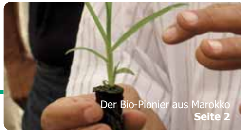
Der Bio-Pionier aus Marokko Seite 2