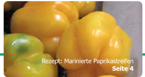
Rezept: Marinierte Paprikastreifen Seite 4